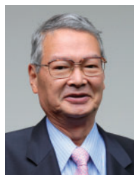
大橋 洋治 全日本空輸株式会社 取締役会長