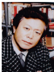
猪瀬 直樹 作家・東京都副知事