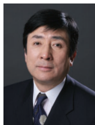
手嶋 龍一 外交ジャーナリスト