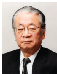
堺屋 太一 作家