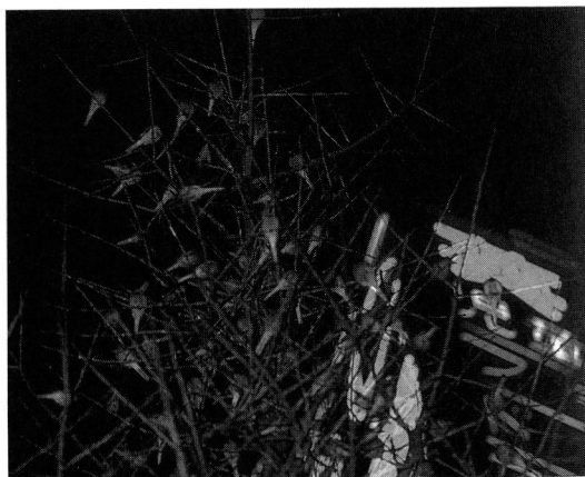
Fig.2 渋谷駅近くの街路樹(イチョウ)でねぐらをとるハクセキレイ

ハクセキレイの集団ねぐらで興味深いのは、街路樹を利用するだけでなく、ビルの窓枠や屋上のネオン塔、広告塔、電線、架橋の下側の配線や配管などを利用することである。渋谷駅近くの場合には、街