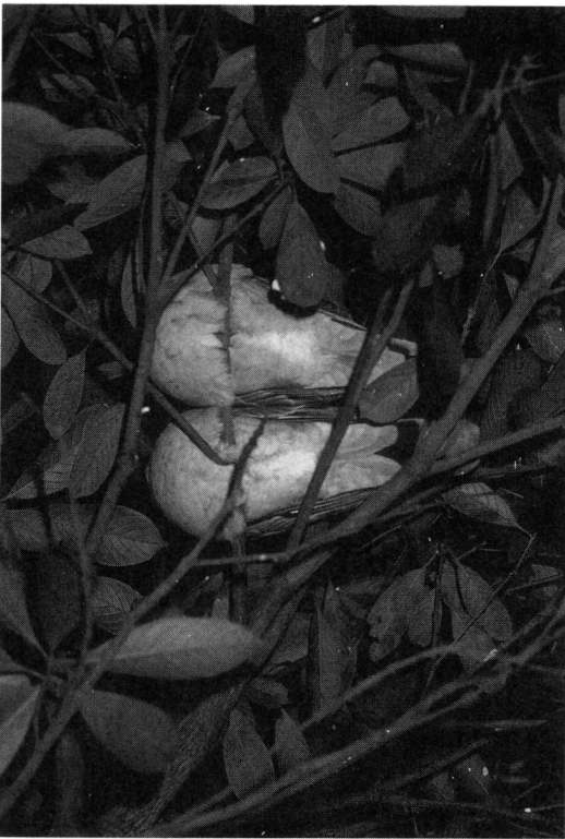
Fig.3 市川駅近くの交差点のマテバシイで番いねぐらをとるキジバト

また、スズメやシジュウカラ、メジロ、ウグイス、エナガなどの小型鳥類にとっては、枝の繁った樹木は天敵から逃れる避難場所としても重要である。特